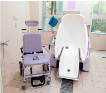
▲特殊浴槽（個室個別対応）