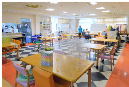
▲開放感のある1階食堂