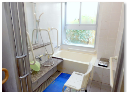
▲坪庭付きの一般浴室