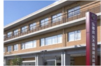
矢木脳神経外科病院 (大阪市東成区)