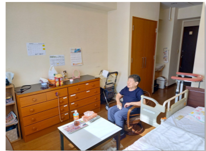
▲ゆったりとした広さの居室。家具は木目調で統一